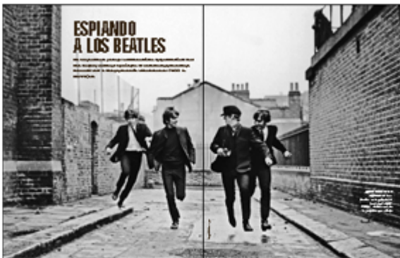
Presentación predeterminada de una imagen de escala de grises