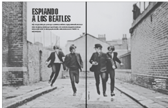
Presentación simulando tinta negra de una imagen de escala de grises

El problema es que aunque ajustemos esas preferencias, la previsualización predeterminada en pantalla de cualquier objeto de escala de grises, ya sea nativo o importado es incorrecta de forma predeterminada: El programa los sigue presentando como si sus tonos fueran negros enriquecidos y los muestra con el tono más oscuro y neutro posible o casi.