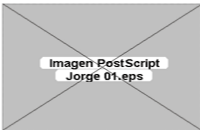
(a) Fichero EPS sin previsualización.

No todos los programas están obligados a trabajar con esa previsualización. En Adobe Illustrator e InDesign se puede elegir si queremos que el programa interprete ("rasterizar": To rasterize ) el código PostScript (mejor visualización, peor rendimiento) o no. En Photoshop no hay opción ya que el código se rasteriza siempre (salvo en los contados casos de formas vectoriales y de trazados de recorte, como veremos más adelante). En Quark XPress sólo se puede trabajar con esa visualización, salvo que se adquiera una Xtensión como Enhance Preview XT .