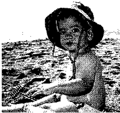
(b) Fichero EPS con previsualización de 1 Bit (imagen de mapa de bits tramada).