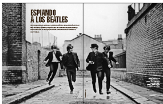
Presentación predeterminada de una imagen de escala de grises